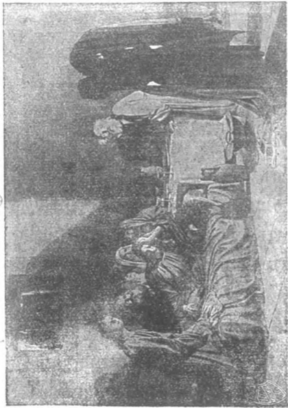
„Тайная вечеря“. Съ картины П. Н. Ге.