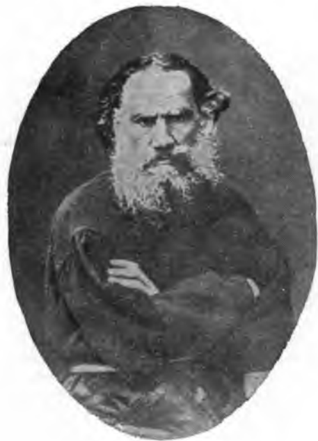
Л. Н. Толстой, 1885 г. (Фото).