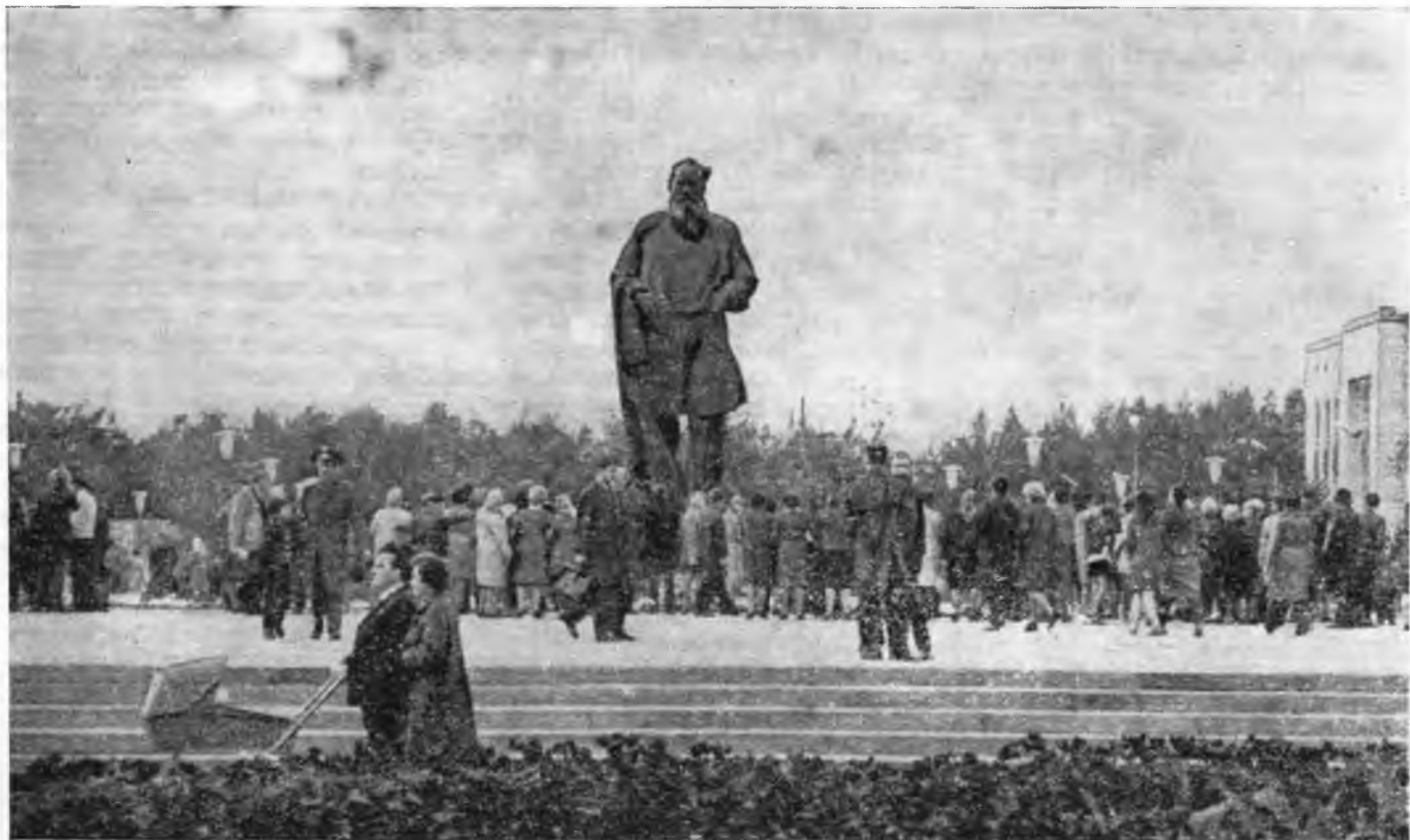
Открытие памятника Л. Н. Толстому в Туле. (Фото).