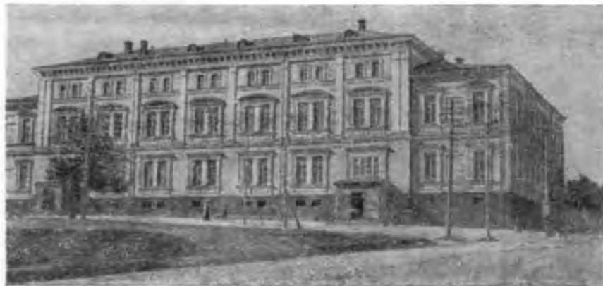
Здание бывшего Тульского дворянского собрания (теперь Дом офицеров). (С открытки конца XIX в.).

пространности подобных случаев. Как пронзительно заметил Горький в одной из своих статей в «Самарской газете» в связи с постановкой «Власти тьмы» самарским театром, сама жизнь оправдывала Толстого от нападок тех критиков, которые упрекали автора пьесы в чрезмерном сгущении красок.