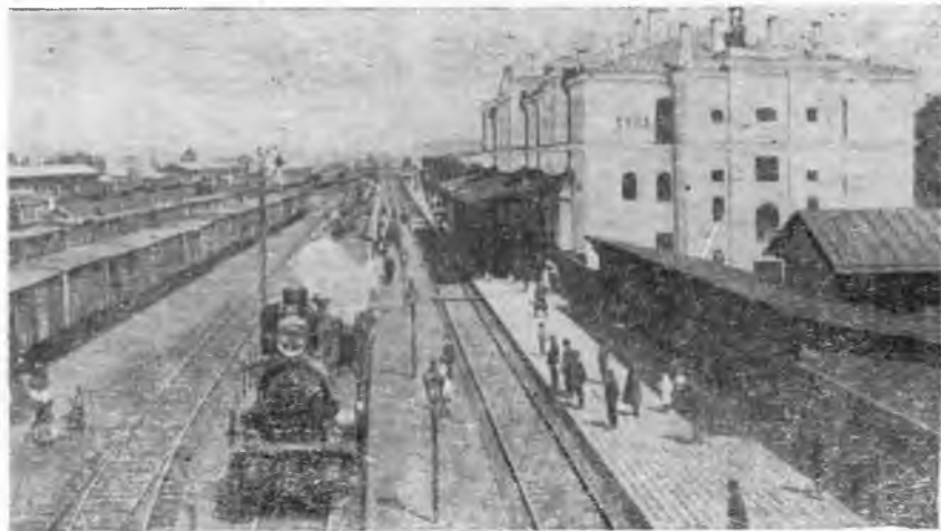
У перрона бывшего Курского вокзала в Туле (с открытки конца XIX в.).

Из Тулы в Ясную Поляну приезжали врачи, оказывая помощь членам толстовской семьи. Тульские учителя готовили сыновей писателя к гимназическим экзаменам. Толстые