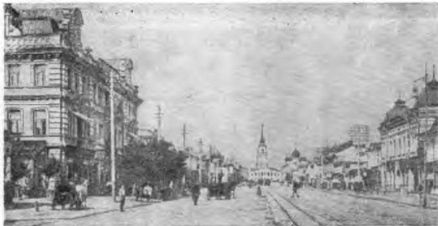
Улица Киевская, центральная улица Тулы, на которой часто бывал Л. Н. Толстой и члены его семьи (с открытки конца XIX в.). Ныне проспект Ленина.