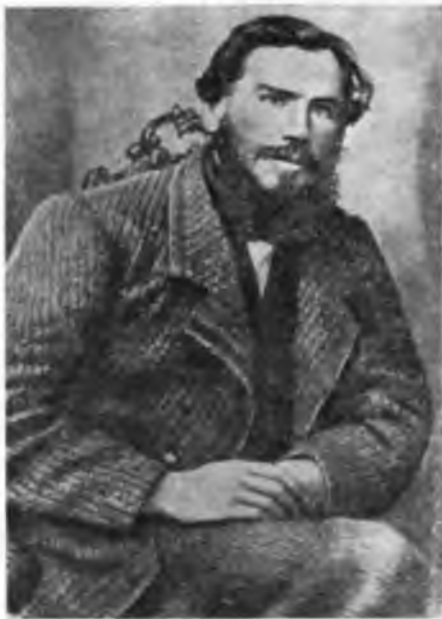
Л. Н. Толстой, 1862 г. (Фото).

В фондах Тульского дворянского депутатского собрания Государственного архива Тульской области хранятся документы о службе Толстого в качестве канцелярского служителя Тульского губернского правления. Этот факт биографии Толстого отно-