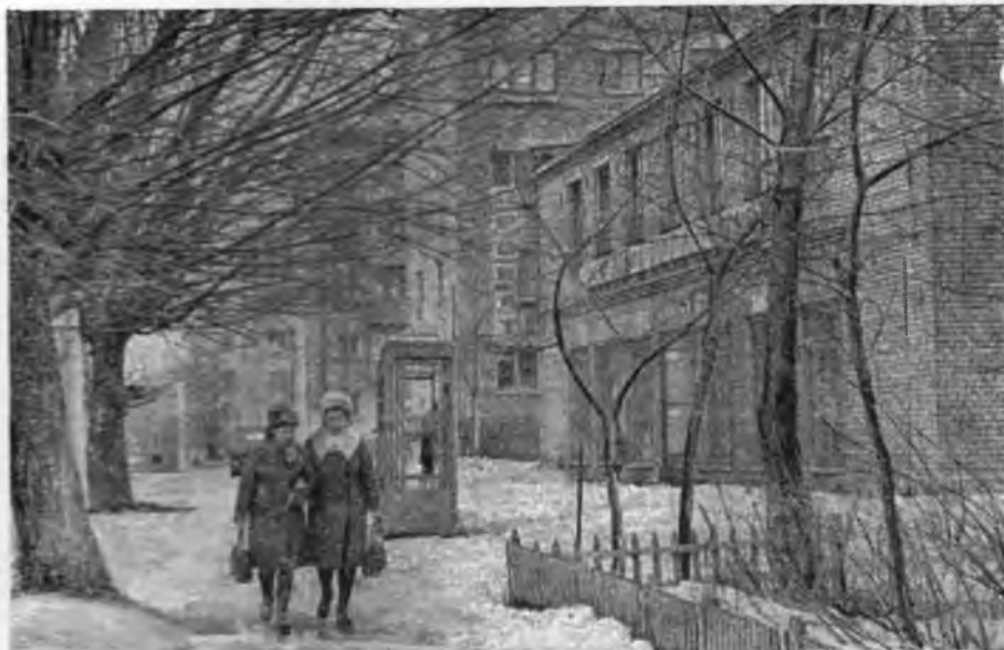
Тула. Улица Л. Н. Толстого. (Фото, 1975 г.).

«антихриста». Но трогательно отнесся к этому событию простой народ, говоривший о необходимости установления дня траура. «После двух часов дня из Тулы потянулась вереница экипажей в Ясную Поляну с туляками, пожелавшими отдать последний долг родному писателю». «Местные