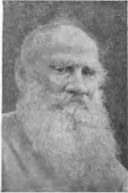
Л. Н. Толстой (1900-е годы). (Фото).

с полной точностью воспроизводят моменты из биографии Ивана Ильича Мечникова. ...Даже второстепенные подробности повествования строго учитывают реальную обстановку повести» 33 .