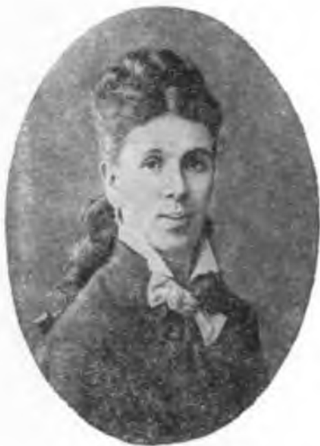
Т. А. Кузминская (Берс) (1846—1925), свояченица Л. Н. Толстого. В 1867—1868 гг. жила со своей семьей в Туле на улице Старо-Дворянской (ныне ул. Бундурина).

ного училища. Группа реалистов посетила писателя в Ясной Поляне 1 мая 1910 г.