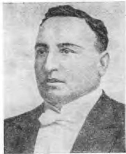
А. И. Южин (Сумбатов) (1857—1927). (Фото).

Атмосфера тульской премьеры «Плодов просвещения», состоявшейся 15 апреля 1890 г., живо воссоздана в корреспонденции «Тульских губернских ведомостей»: «Билеты на представление были разобраны и при входе в залу постоянно приходилось слышать об отказах в местах, не только местным жителям, но и приезжим