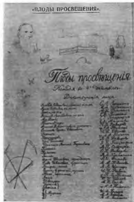
Программа первой постановки пьесы «Плоды просвещения» в доме Л. Н. Толстого 30 декабря 1889 г.

просвещения», который состоялся в Ясной Поляне 30 декабря 1889 г. По его инициативе состоялось и первое публичное представление этой толстовской комедии в Туле, в зале тогдашнего дворянского собрания (теперь Дом офицеров). «Репетиции происходили частью у меня, частью в дворянском собрании, на сцене, — рассказывает Давыдов о тульском спектакле. — В одну из этих репетиций сторож доложил мне, что какой-то мужик, по-видимому трезвый, желает непременно видеть меня и требует, чтобы его пустили в залу.