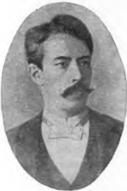
К. С. Станиславский (1863—1938).