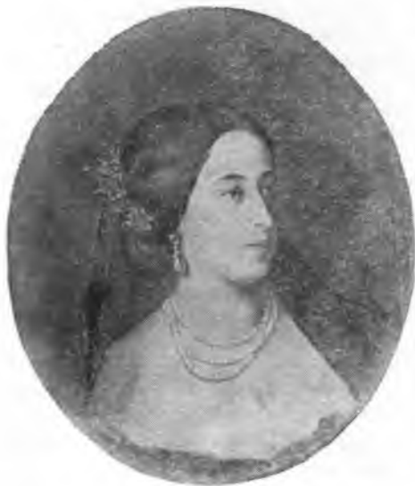
М. А. Гартунг (1832—1919). С работы художника И. К. Макарова.

ботал над последним крупным своим произведением — романом «Воскресение». Это было время, когда в духовном развитии писателя произошел коренной перелом, когда он порвал со всеми взглядами своей среды, перешел на позиции патриархального крестьянства, стал представителем и защитником интересов многомиллионных народных масс России, когда он, по словам В. И. Ленина, «обрушился с страстной критикой на все современные государственные, церковные, общественные, экономические порядки, основанные на порабощении масс, на нищете их, на разорении крестьян и мелких хозяев вообще, на насилии и лицемерии, которые сверху донизу пропитывают всю современную жизнь» 21 . В то же время обостряются «кричащие противоречия» великого писателя и мыслителя, пытающегося найти выход из социальных противоречий в нравственном самоусовершенствовании, в проповеди непротивления злу насилем, проповеди новой «очищенной» религии (при острейшем конфликте с официальным православием, с церковью),—