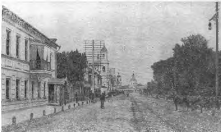
Улица, на которой располагалась Тульская мужская гимназия (с открытки конца XIX в.). Ныне ул. Менделеевская.

Толстой познакомился с кружком тульских педагогов в 1859 г., в доме Ю. Ф. Ауэрбах, начальницы женской гимназии (одной из первых женских