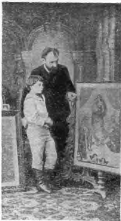
Л. Д. Урусов (ум. 1885). (Фото).