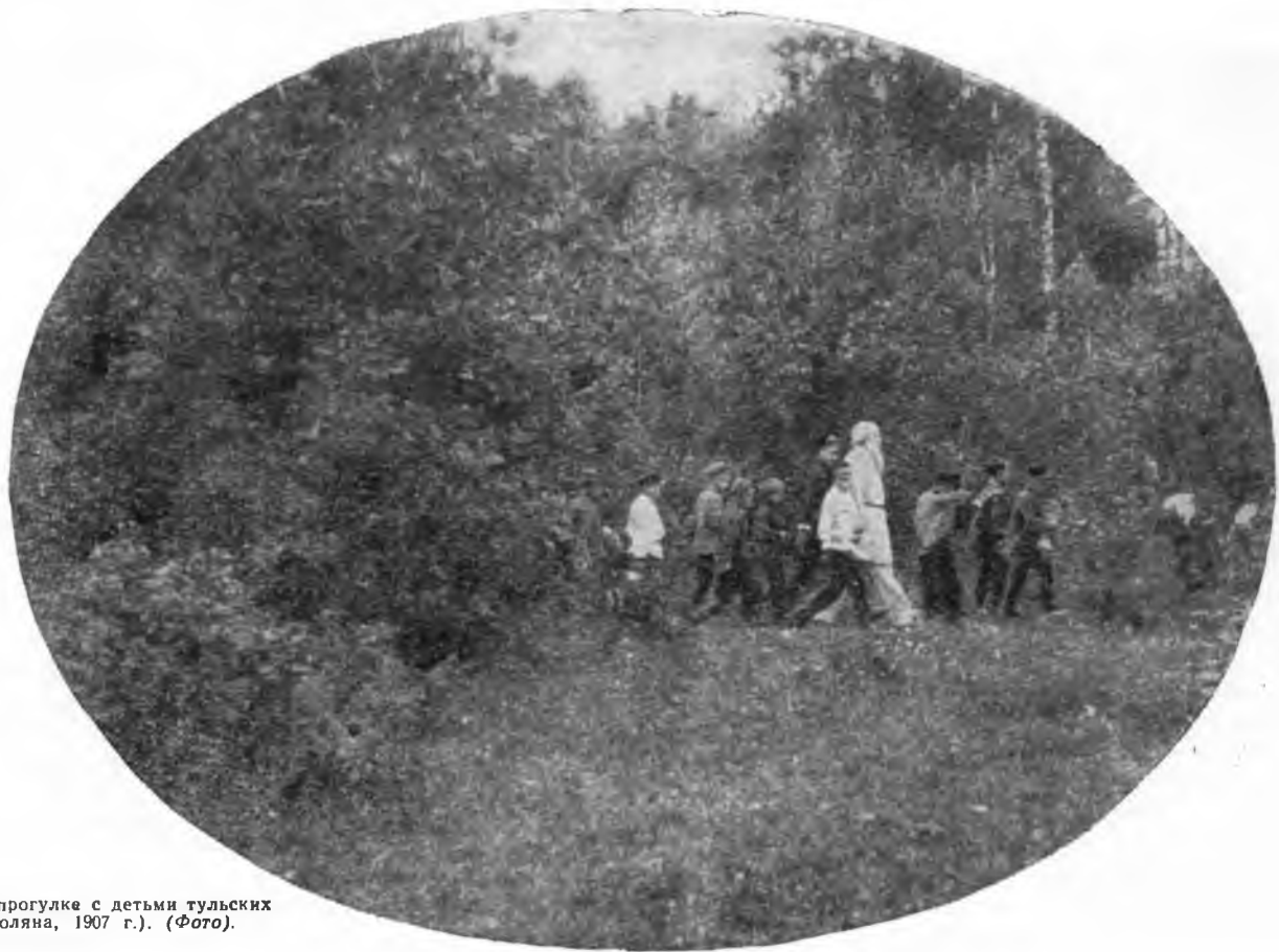
Л. Н. Толстой на прогулке с детьми тульских рабочих (Ясная Поляна, 1907 г.). (Фото).