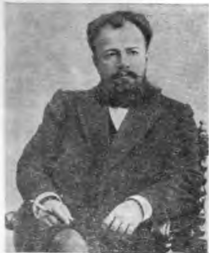
Вл. И. Немирович-Данченко (1858—1943).

«Мы его и гнали уже, да не идет»,— добавил сторож. Я побежал вниз в швейцарскую, догадавшись, кто этот мужик, и через несколько минут ввел в залу, к великой радости участвовавших в пьесе, Льва Николаевича, принятого за «мужика» сторожами ввиду его более чем скромной одежды. Спектакль удался в полной мере» 26 .